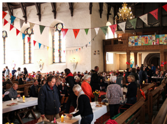
Korskirken er pyntet til fest og fylt med gjester som vil hedre tiltakene.