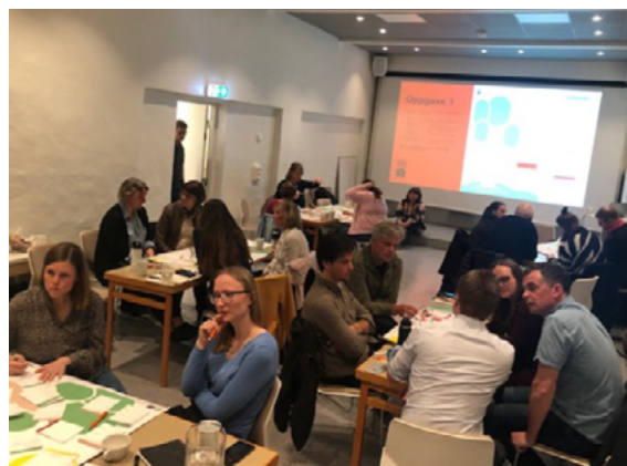
Ansatte har vært engasjert i utarbeidelsen av nasjonal strategi, her fra Korskirken og Kong Oscarsgate 62.