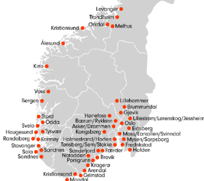
Stiftelsen Kirkens Bymisjon Byer og tettsteder

Stiftelsen Kirkens Bymisjon er organisert med et styre, en generalsekretær og et representantskap som ledende organer. Styret er stiftelsens øverste organ. Forvaltningen av stiftelsen hører under styret og styret skal sørge for at stiftelsens formål ivaretas. Generalsekretæren sørger for den daglige ledelse og representerer stiftelsen utad i saker som inngår i den daglige ledelse. Representantskapet fører tilsyn med stiftelsens virksomhet.