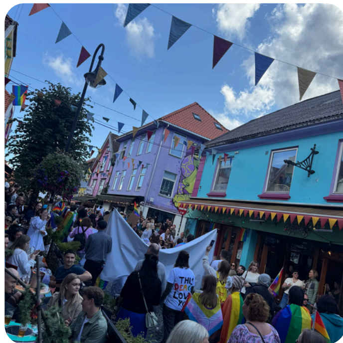
Ung retts hjelp deltok i Pride-paraden sammen med andre tiltak i Kirkens Bymisjon

Ung retts hjelp tok inn 5 saker i forbindelse med saksmottakene i fengsel, i tillegg kommer etterfølgende henvendelser fra innsatte.